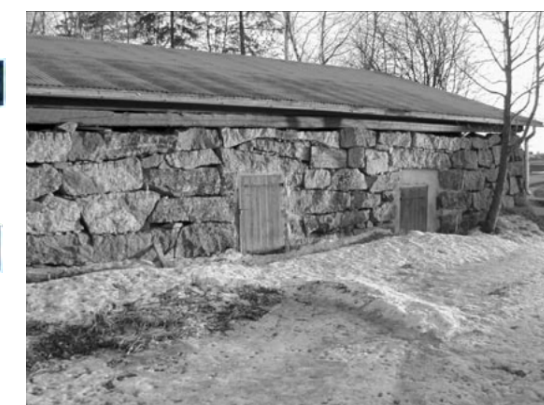
Kuva. Kuninkaan kivikellari, kartalla B2. http://arkeonyt.mbnet.fi/arkeonyt/arkeonyt.pdf

Raukkaan kylässä 4,5 km keskustasta 193-tien varrella Suomen vanhin vielä vuonna 1994 toiminnassa ollut mylly